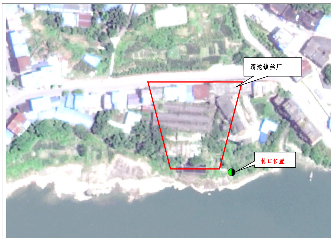
图 2 排口周边环境

经溯源，该排口为重庆市合川区渭沱镇丝厂的雨洪排口，经多次现场排查，该排口未发现排水，周边未发现明显污染源。排口已废弃但未处理处置，存在借道排污等风险隐患。