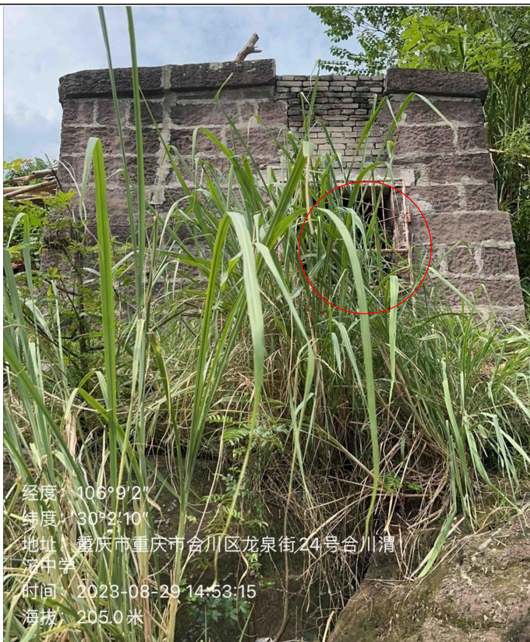
时间：2023年8月29日无水照片