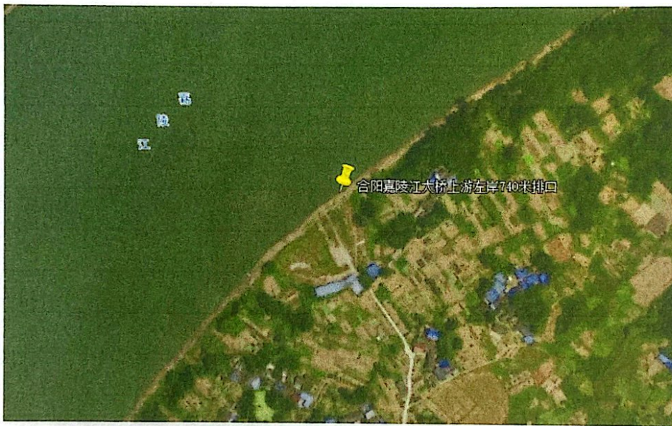
排口及其外环境关系图