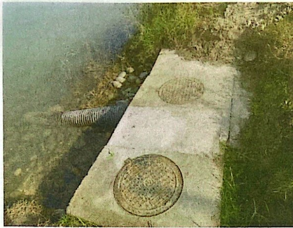
丰水时期的现场环境